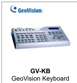
GV-KB GeoVision Keyboard